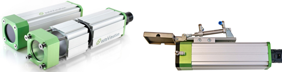
Bild: Salamander-Zwischenstück für große Objektive (links), Schutzklappe für stark verschmutzte Umgebungen (rechts)

ralängsachse als auch in der Spiegelachse verstellbar. Auf Wunsch können auch Sondergrößen, z.B. für Weitwinkelobjektive, hergestellt werden.