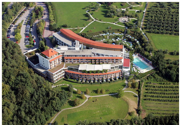
Der Steirerhof im steirischen Thermenland

Zu seinen Referenzen zählt TAC Topadressen aus dem In- und Ausland, etwa Hyatt Hotels Corporation, Lindner Hotels & Resorts, das Grand Resort Bad Ragaz, das InterAlpen-Hotel Tyrol und das Schloss Pichlarn SPA & Golf Resort.