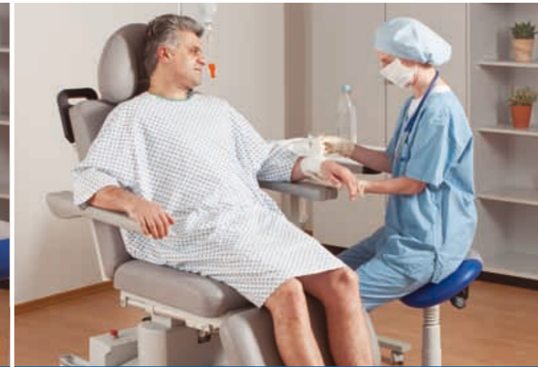
Aufrechte Sitzposition für ein einfaches Aus- und Einsteigen nach der ambulanten OP

Die RecoLine stellt ein neues Konzept für den Aufwachraum des ambulanten OPs dar. Sie wurde speziell für die Bedürfnisse von Patienten und Pflegepersonal, vor und nach einer Operation, entwickelt und bietet so mehr Komfort und Flexibilität in Ihrem Aufwachraum.