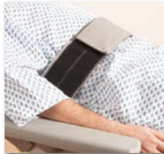
Beckengurt zur weiteren Absicherung Ihrer Patienten