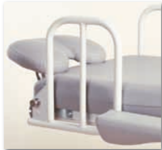
Kleine abklappbare Kopfteil-Seitensicherung, kann als Schiebegriff genutzt werden