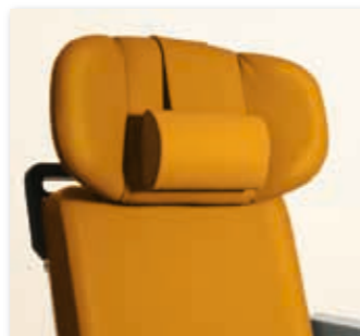
Premium-Kopfteil mit beweglichen Seitenteilen und Nackenrolle