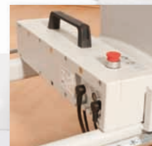
Durch den Akkubetrieb ist Netzunabhängigkeit garantiert und die RecoLine kann jederzeit frei bewegt werden.