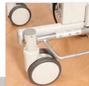
12,5 cm große Rollen mit Richtungsfeststeller sorgen für ein leichtes Verschieben der RecoLine. Mittels Zentralbremse werden alle vier Rollen gleichzeitig blockiert.