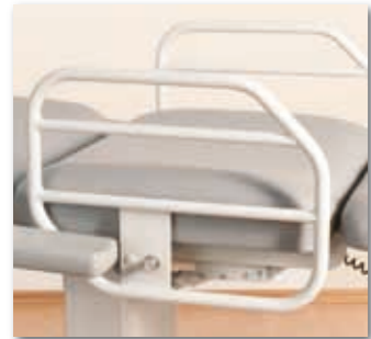
Abklappbare große Seitensicherung für den Patienten während der Aufwachphase