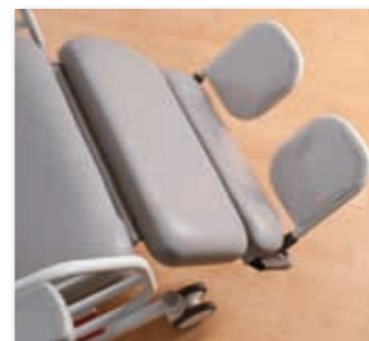
Abnehmbare Fußstützen mit Aufbewahrungsmöglichkeit unter dem Beinteil