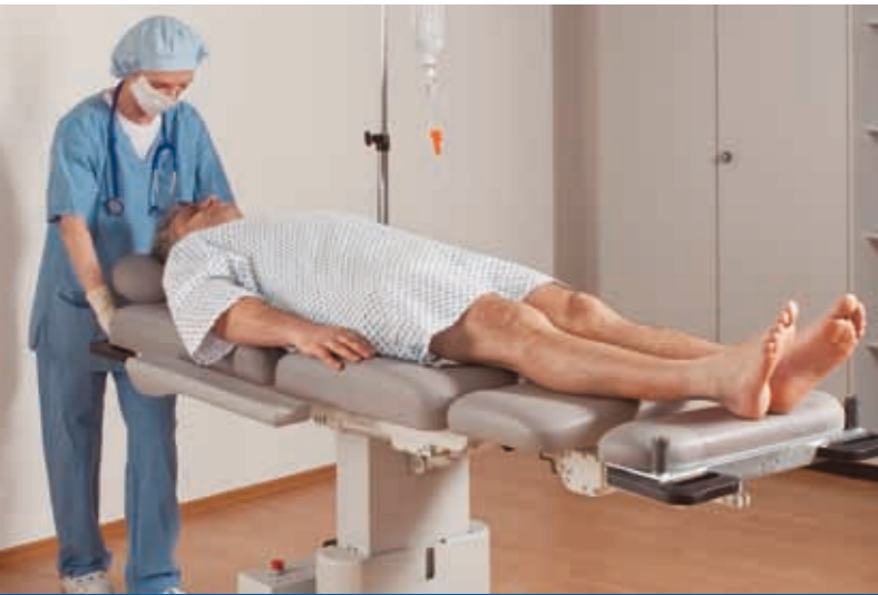
Einfaches Umbetten Ihres Patienten vom OP-Tisch auf die RecoLine durch elektrische Höhenverstellung