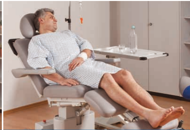
Variable und bequeme Liegepositionen für eine schnelle und angenehme Mobilisierung Ihrer Patienten