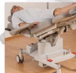
In Notfällen kann per rotem Fußschalter beidseitig die Schockposition aktiviert werden. Das Pflegepersonal hat beide Hände für die Hilfe am Patienten frei.