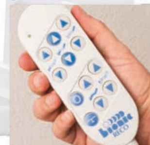
Der einfach zu bedienende Handschalter zur individuellen Einstellung der Liege- oder Sitzposition bietet Flexibilität für Ihre Patienten und Ihr Personal.