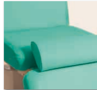
Eine bequeme Knierolle sorgt für zusätzlichen Komfort