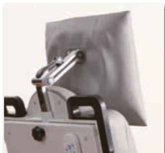
Das anpassbare 2D-Comfort-Kopfteil für die optimale Sitzposition Ihrer Patienten