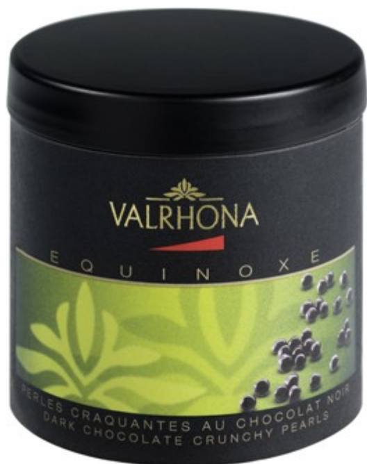
Box dunkle Schokoladenperlen 75 Gramm UVP: 6,90EUR