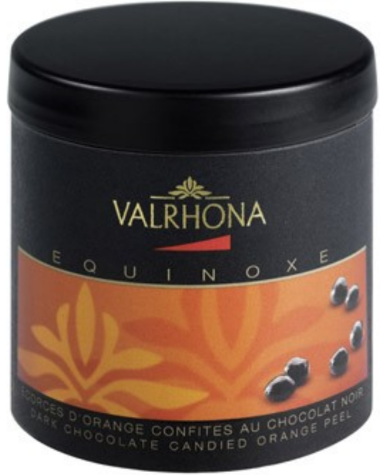
Box Orangenstückchen in dunkler Schokolade 75 Gramm UVP: 6,90EUR