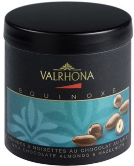
Box Mandeln & Haselnüsse in Milkschokolade 75 Gramm UVP: 6,90EUR