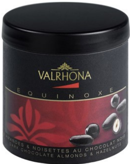
Box Mandeln & Haselnüsse in dunkler Schokolade 75 Gramm UVP: 6,90EUR