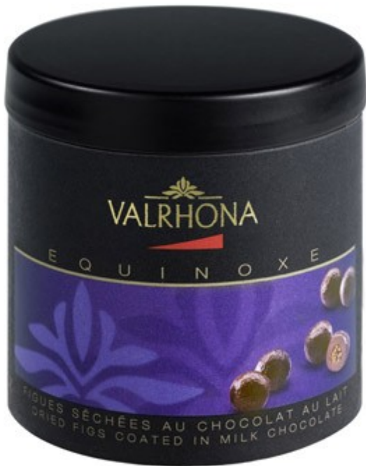
Box Feigen & Bisquit in Milkschokolade 75 Gramm UVP: 6,90EUR